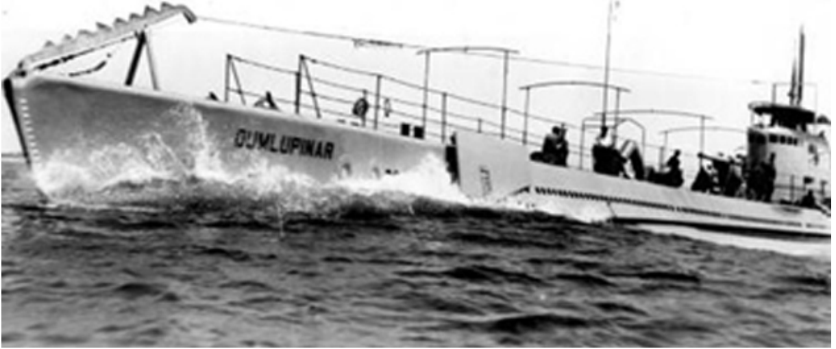
Dumlupınar (1) ve Sakarya (1) Denizaltıları