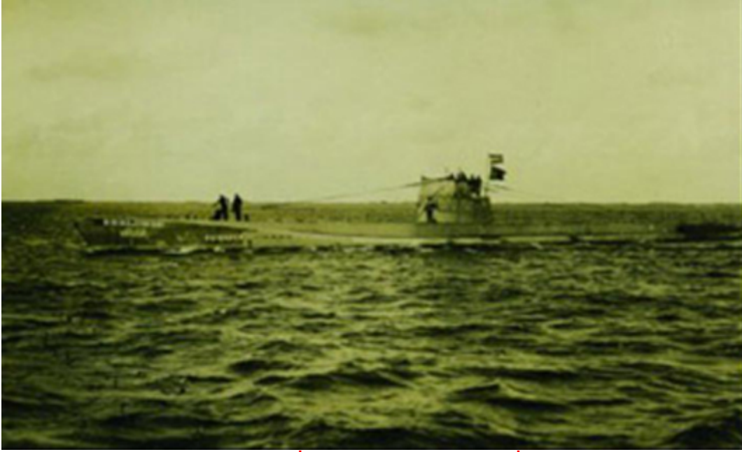
Cumhuriyet Dönemi'nin İlk Yeni Gemilerinden I. İnönü Denizaltısı

Cumhuriyet Dönemi'nde ilk denizaltı alma teşebbüsü, 1924 yılında gerçekleşmiştir. Üç kişilik bir heyet Fransa, Hollanda ve İsveç'e giderek gemileri tetkik etmiş; Türkiye'nin ticari ilişkileri de göz önünde tutularak Hollanda'dan denizaltı alınmasına karar verilmiştir.